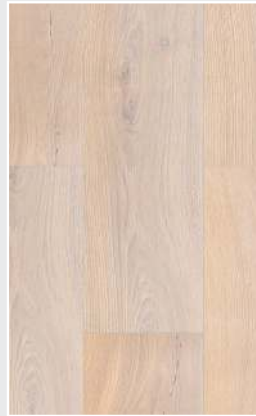
Tammi Vita MICO201226-32