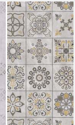
Stone Ornament MICO201236-32