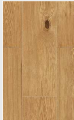
Tammi Light MICO201225-32