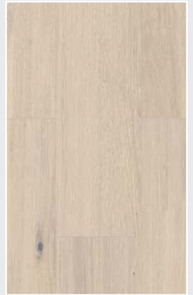
Talvitammi Cream MICO200609-32