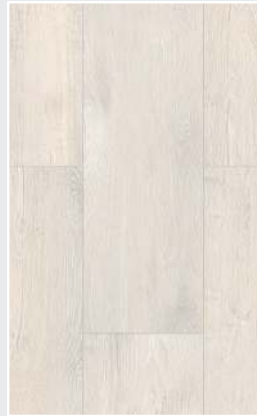
Tammi Finnish MICO201025-32

Tutustu Micodurin puu-, kivi- ja betonikuoseihin sekä sen ainutlaatuisiin teknisiin ominaisuuksiin – näitä etuja ja hyötyjä et löydä miltyään muulta uivaksi asennettavalta lattiatuotteelta.