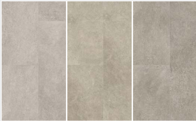
Betoni Silver MICO201020-32