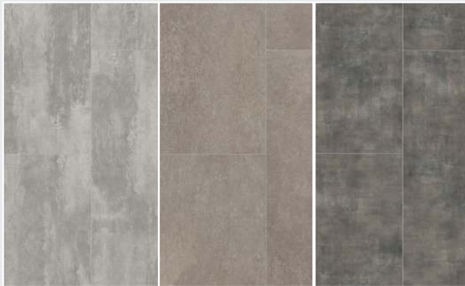
Betoni Ferro MICO221027-32