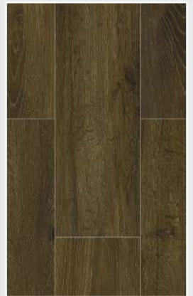
Savutammi Olive MICO201016-32

PAKETTI- JA LAVAKOOT 6 lautaa = 1,482 m 2 = n. 17,8 kg 52 pkt = 77,064 m 2 = n. 925 kg