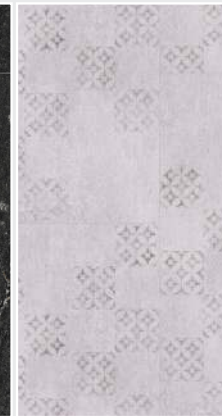
Stone Retro MICO201223-32