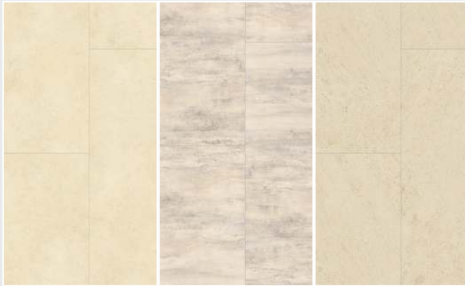
Betoni White MICO201021-32